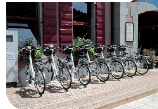
● Les Vélibs des Gets