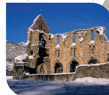
● L'Abbaye d'Aulps - Saint-Jean d'Aulps