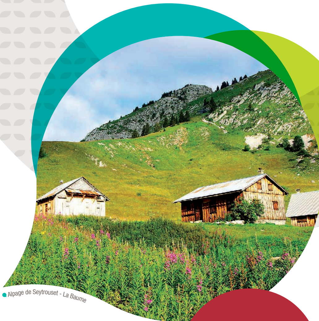
● Alpage de Seytrouset - La Baume