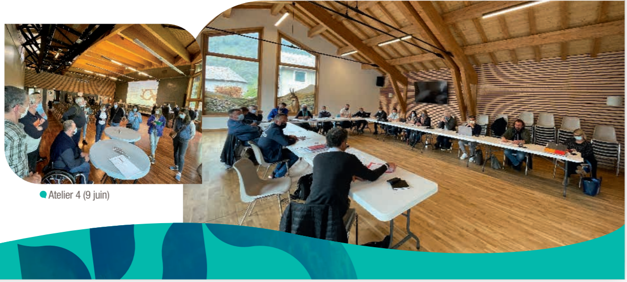
● Atelier 4 (9 juin)